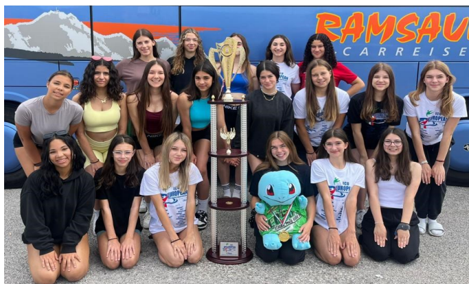
👍 Das Europameister-Winnerteam 👍